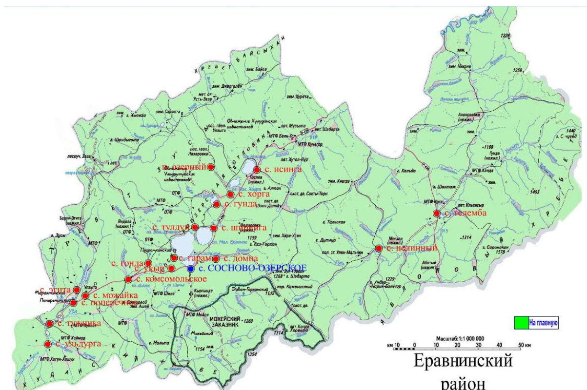
Карта-схема МО «Еравнинский район»

Актуальная информация о составе администраций сельских поселений и их контактных данных на сайте http://yaruuna.ru/